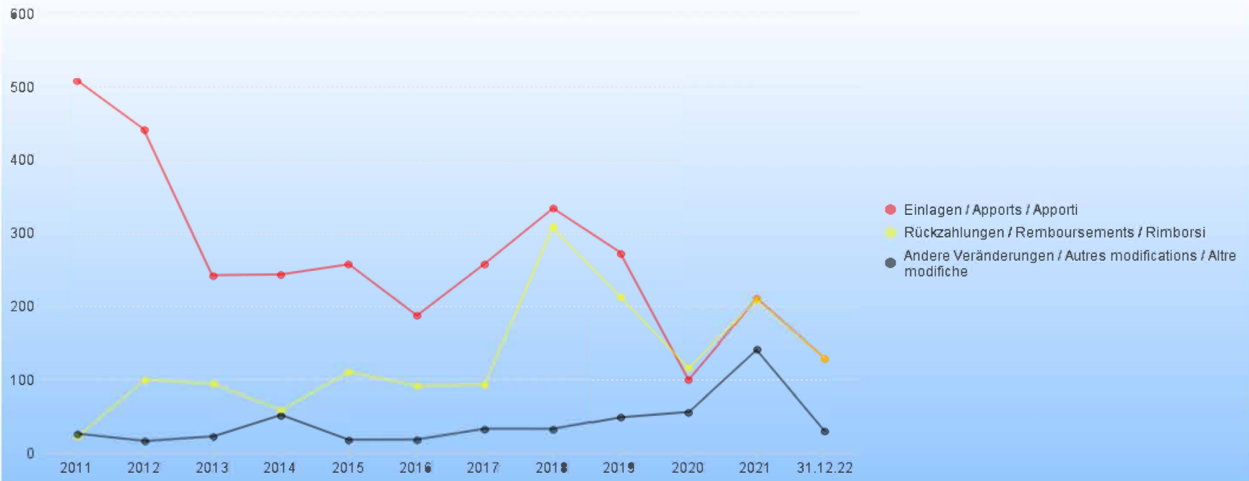
Veränderungen von Kapitaleinlagen in Milliarden CHF / Variations des apports de capital en milliards CHF / Variazioni degli apporti di capitale in miliardi CHF